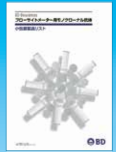
小包装抗体製品カタログ

少量で多種類の抗体を揃えたい。この抗体は少量しか使用しない。試しに使用してみたい。 信頼できる BD ブランド製品をご提供致します。まとめ買い等の場合には弊社営業までご相談ください。