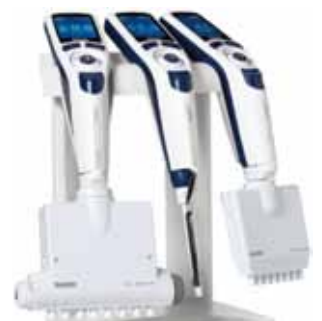
E4-RCSUNI 急速充電スタンド 価格 ¥26,000-