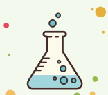
RushMab - スーパー