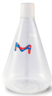
すりガラス接続 フラスコ (1 L)