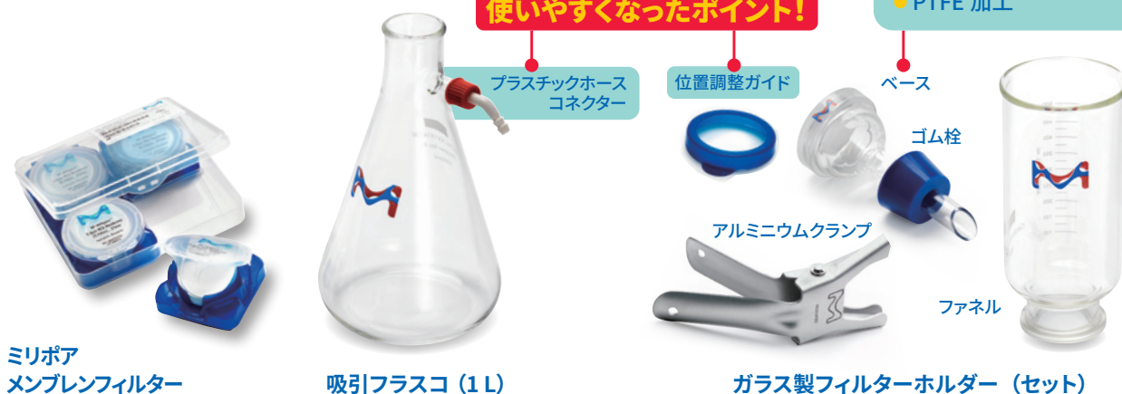
ミリポア メンブレンフィルター