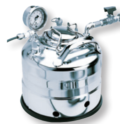
加圧タンク キット