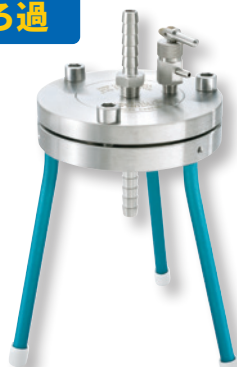
ステンレス製 90 mm フィルターホルダー