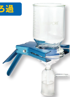
全ガラス製 90 mm フィルターホルダー ステンレススクリーン