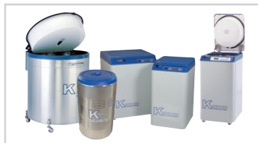
Kシリーズ 大量試料保存用容器 ※3年間真空保証