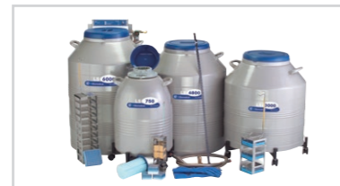
LSシリーズ ラック式凍結保存容器 ※3年間真空保証