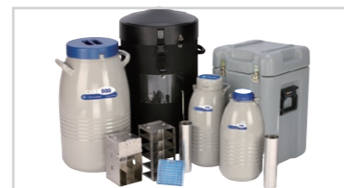
CXシリーズ 試料運搬用容器 ※3年間真空保証