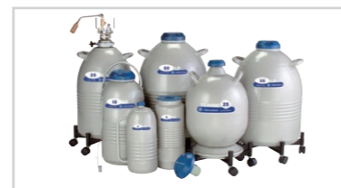
LDシリーズ 液体窒素運搬用容器 ※5年間真空保証