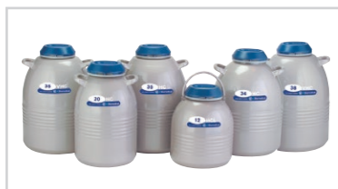
HC/TWシリーズ 多量試料保存用容器 ※5年間真空保証