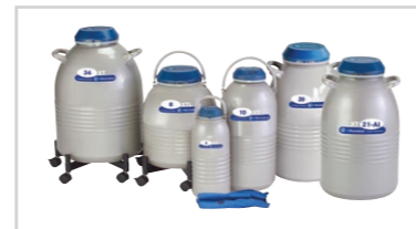
XT/XTL/TWシリーズ 長期保存用容器 ※5年間真空保証