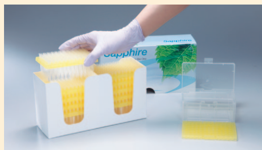
外側カバーを外し、リロードチップを取り出します。