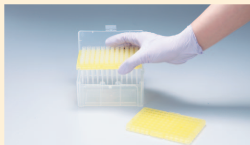
専用ラックの中敷きを取り除いてセットします。