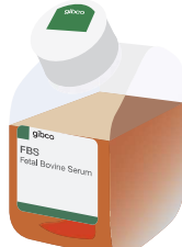
Gibco boxy bottle 2008-現在