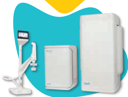
Milli-Q IQ 7003/05