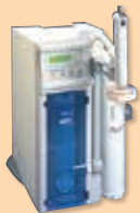
'96 Milli-Q Academic /Gradient /Biocel /Synthesis /Element

2020年12月末をもちまして、下記製品の修理パーツ販売を終了させていただく予定です。 長らくご愛顧いただきましたお客様に、引き続き超純水製造装置を安心してご利用いただけるようリニューアルキャンペーンをご用意いたしました。これで、業務に影響を及ぼすリスクを軽減し、安心してご利用いただけます。