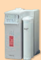
'01 Elix UV 3/5/10