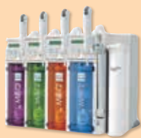
'01 Milli-Q Academic /Gradient /Biocel /Synthesis /Element