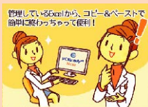
管理している60mlから、コピー&ペーストで 簡単に発行ちゃって便利!

お手元で管理している エクセルシート/メモ帳から、 複数本のプライマーを まとめてコピー&ペーストして完了!