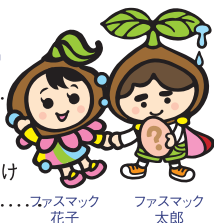
ファスマック 花子 ファスマック 太郎