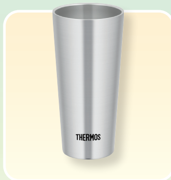
サーモス タンブラー