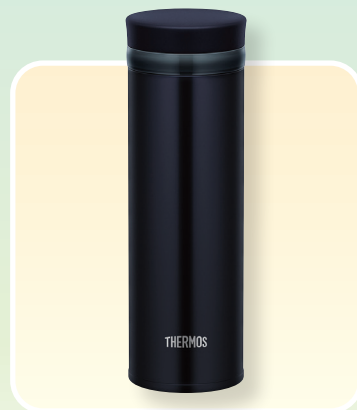
サーモス 真空断熱ケータイマグ