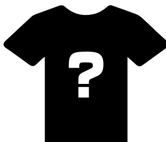
オリジナルTシャツ