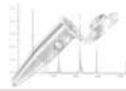
タンパク質 低吸着性チューブ