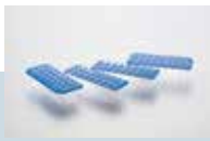
分割可能な PCRプレート