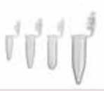
核酸低吸着性 チューブ