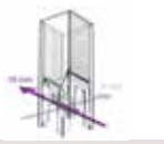
ディスポーザブル キュベット