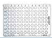
核酸低吸着性 PCRプレート