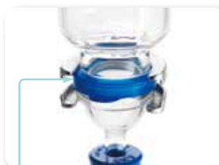
位置調整ガイド (標準付属) クランプ取り付け時にずれません