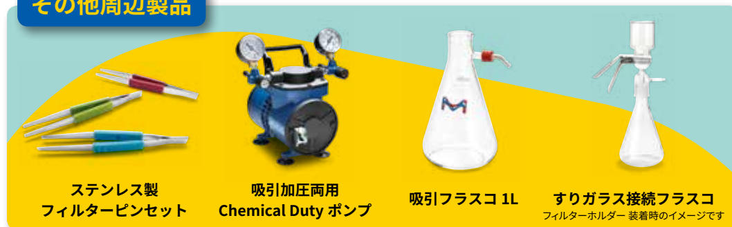
ステンレス製 フィルターピンセット