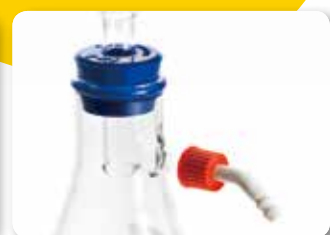
プラスチックホースコネクター (吸引フラスコに付属) 簡単&安全に取り付け&取り外し