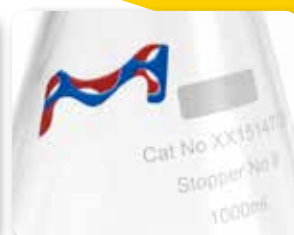
型番明記と書き込みスペース 直接書き込める白いスペース があります