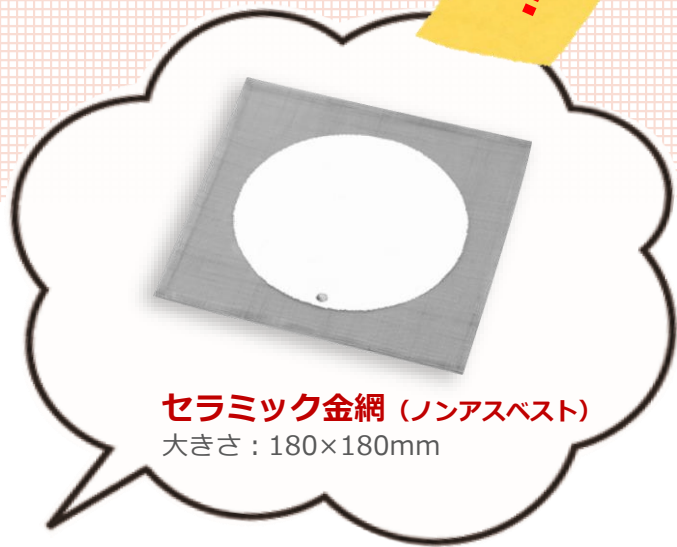
セラミック金網 (ノンアスベスト) 大きさ : 180×180mm